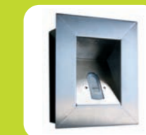
Wandebauset Ed (vandalenhemmend)