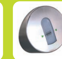
Abdeckung rund Ed gold