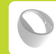
Abdeckung rund Ed