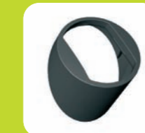
Abdeckung rund Ku anthrazit bzw. weiß