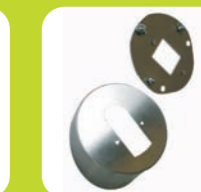
Abdeckung rund Ed sec (vandalenhemmend)